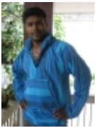
Coat À capuche bleu €39.00

Cette magnifique petite blouse rouge aux manches 3/4 ballon est faite en 100% coton soyeux. Elle s'accorde parfaitement sur un pantalon comme une jupe pour un style d'contract et glamour. [Détails du produit...]