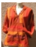
Coat À capuche orange €39.00

Coat H/F de couleur bleu À capuche, 100 % drap de coton tissé main. [Détails du produit...]