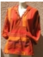
Coat À capuche orange €39.00

Coat H/F de couleur bleu À capuche, 100 % drap de coton tissé main. [Détails du produit...]