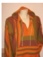
Coat À capuche orange-mauve €39.00

Coat H/F de couleur orange À capuche, 100 % drap de coton tissé main. [Détails du produit...]