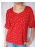
Blouse rouge €22.00

Cette magnifique petite blouse rouge aux manches 3/4 ballon est faite en 100% coton soyeux. Elle s'accorde parfaitement sur un pantalon comme une jupe pour un style d'contract et glamour. [Détails du produit...]