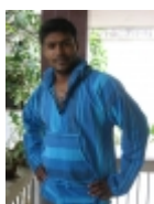
Coat À capuche bleu €39.00

Cette magnifique petite blouse rouge aux manches 3/4 ballon est faite en 100% coton soyeux. Elle s'accorde parfaitement sur un pantalon comme une jupe pour un style d'contract et glamour. [Détails du produit...]