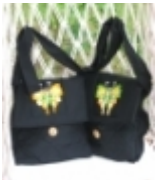
black butterfly bag